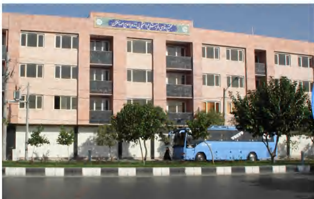
مجتمع خوابگاهی زنده یاد حاج احمد ناظران

طبق دستورالعمل ستاد کرونا ملاک پذیرش میهمانان محترم در خوابگاه‌ها تزریق ۲ دوز واکسن می باشد.